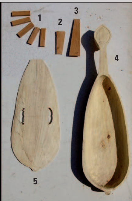
Cl. O. Féraud