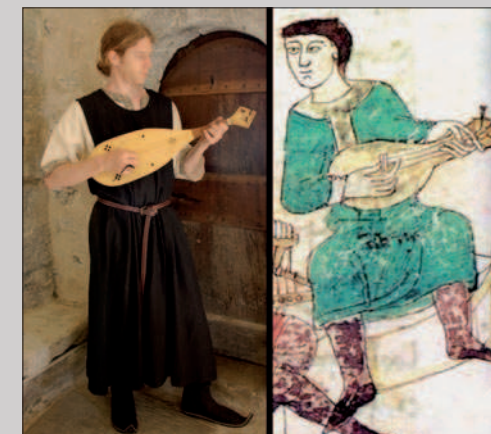
Un luth de type roman, Raban Maur , De rerum naturis , chap.XVIII, XI e siècle. Bibliothèque abbatiale du Mont-Cassin, ms. 132 p. 444.

Si depuis l'empire romain les instruments à corde pincée ont été très en faveur jusqu'à la période carolingienne, les instruments de type luth (à corde pincée et à manche) disparaissent pratiquement de l'iconographie romane, au profit de la vièle, jusqu'à l'arrivée du luth oriental dans le courant du XIII e siècle.