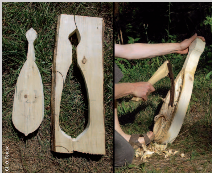
Cl. O. Féraud

À la différence de celui-ci, les chevilles sont disposées verticalement sur le chevillet, et les cordes sont fixées au bas de la caisse, dans la tradition du luth romain. Cet instrument est une proposition de reconstitution d'après une miniature du manuscrit de Monte Cassino (le dépouillement du dessin permet juste de connaître le profil général, le nombre de cordes et la tenue de jeu).